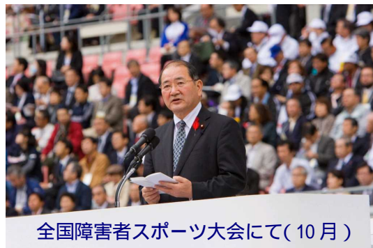
全国障害者スポーツ大会にて(10月)

に参加することです。従来の副大臣のように挨拶が主要任務ということではありませんが、いろいろなイベントで話す機会も多くなっています。